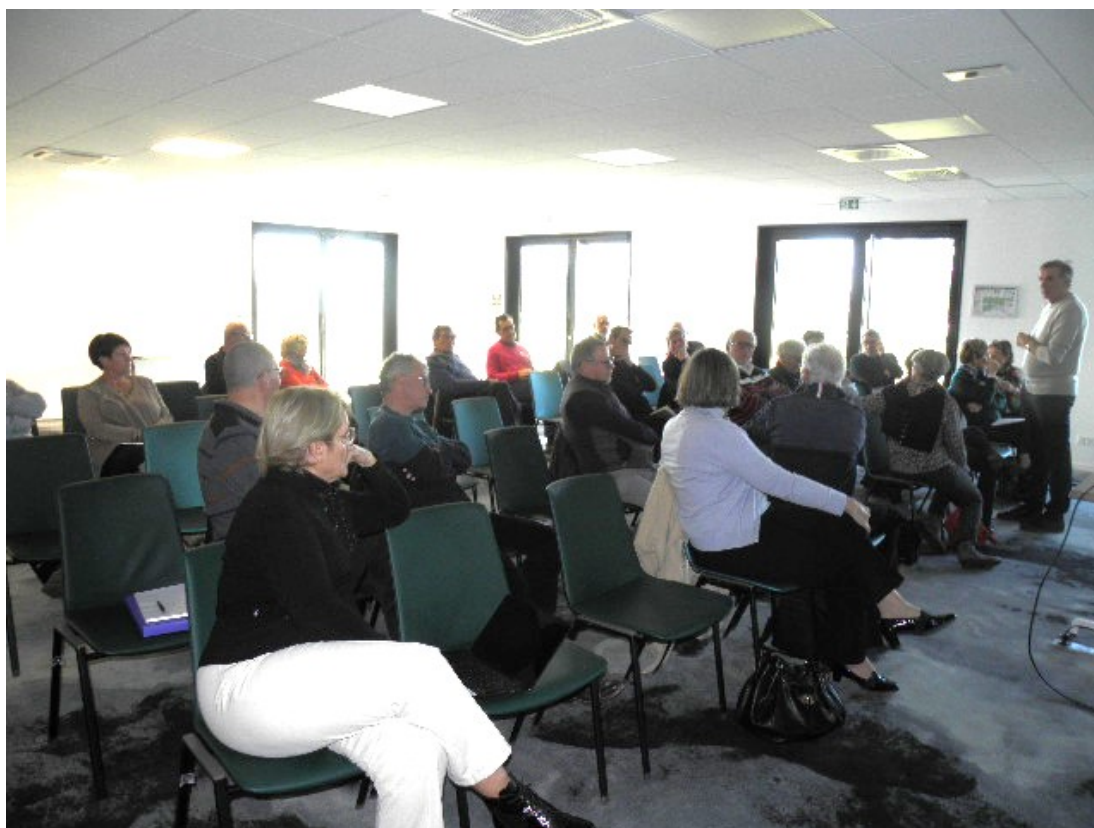
Dialogue avec le Président