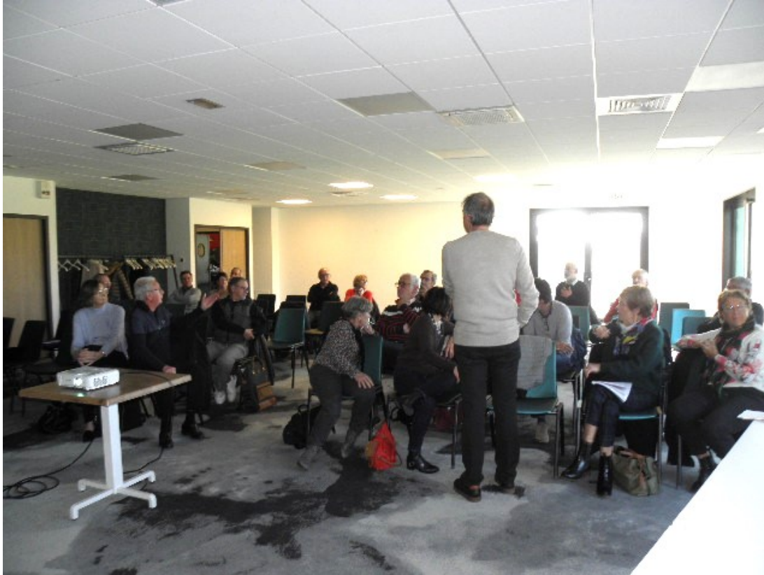
Le Président répond aux questions